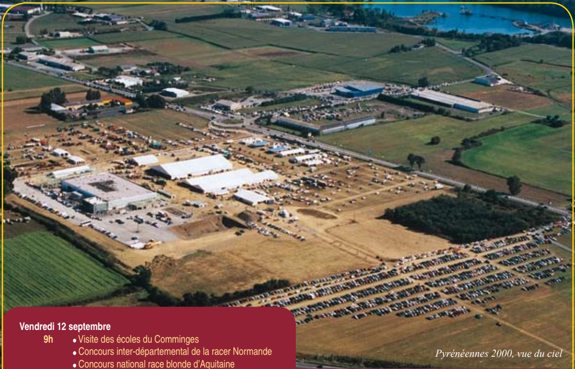
Pyrénées 2000, vue du ciel